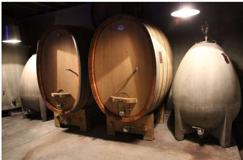
伝統的な楕円形のタンクと新しいコンクリート製の卵型タンク

トカイピノグリ種100%。ストラズブルグの南の科尔マールの町の近くにゾンネングランツの区画があります。この区画の標高は約250メートルで粘土石灰質が主でムール貝の化石が多くみられる畑です。果実味たっぷりで厚みがあり、とてもオイリーでリッチな味わいです。甘いワインになりやすい葡萄品種なので、葡萄をあまり成熟させずにフレッシュな味わいになるように心掛けています。若いうちは品種特有のほろ苦さと固さも見られます。