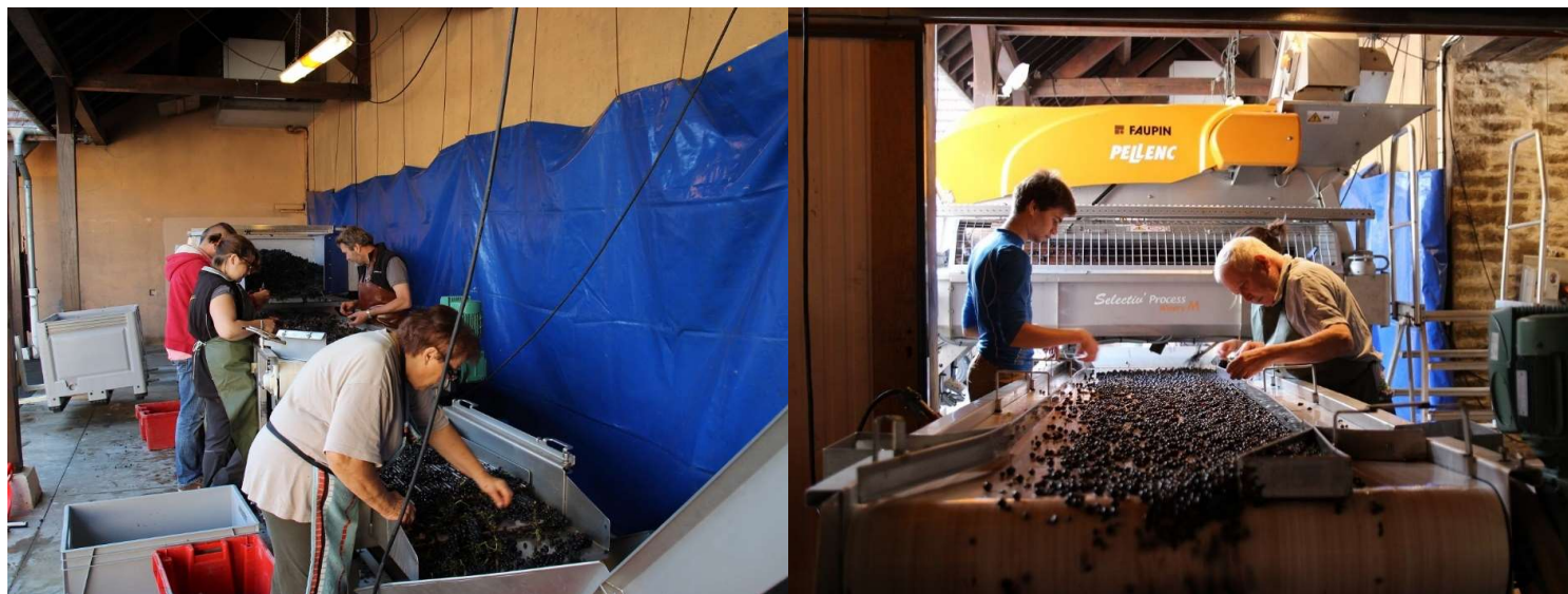
除梗前(左)と除梗後(右)の厳しい2段階選別の様子

ピノ ノワール種100%。基本的にはフランス国内用として生産されており、残念ながら日本に入ってくるのは稀です。ジュヴレ シャンベルタン村の「Champs Franc (シャン フラン)」という区画の葡萄が中心でクロド ヴジヨの麓にある区画の葡萄も使われています。ブルゴーニュブランと同じく買い葡萄も足されているのでこちらもネゴシアン物になります。色調は淡いですが熟したフランボワーズのようなアロマ豊かで果実味たっぷりのワインです。