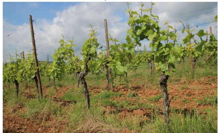
ゲヴェルトトラミネール ゾンネングランツの畑(5月)

ゲヴェルトトラミネール種100%。ストラスブルグの南にあるコルマールの町の近くにゾンネングランツの区画があります。この区画の標高は約250メートルで粘土石灰質土壌が主です。品種特有のミネラルが素晴らしく、肉厚かつオイリーで甘みの強いワインですが、酸味もしっかりあるので飲み飽きしません。「SONNENGLANZ (ゾンネングランツ)」とは太陽の輝きという意味です。