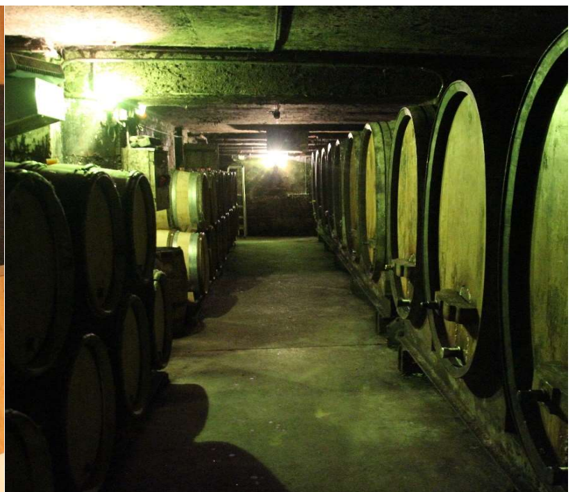
当主のジャン ルイ シャヴ氏(左)とコメントを書き出せないほど薄暗い地下カーヴ(右)