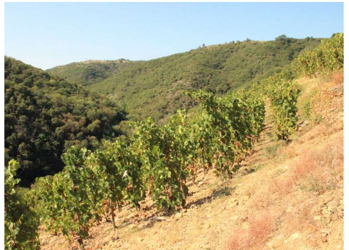
丘の斜面に開墾された急傾斜のルーサンヌの畑

ルーサンヌ種100%。以前に使用していた「Céleste」というキュヴェ名が他社商標登録のため2013年物より変更され「Circa」に。樹齢5～60年で畑は花崗岩土壌の「Mauves(モーヴ)」の区画に位置します。エルミタージュの白との味わいの違いは、エルミタージュが粘土質土壌で優しく柔らかいのに対し、サン ジョゼフは花崗岩土壌がハツラツさとミネラルを表現します。ピワやカラメルの香り、エキゾチックな甘旨味が美味しいワインです。現在は100%自社葡萄で造られています。