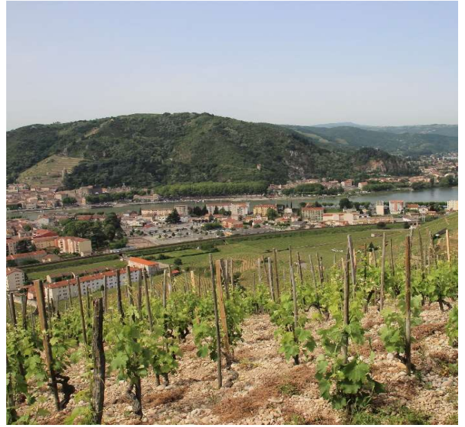
長大なローヌ川を望む小石土壌の畑

シラー種100%。樹齢は古いもので80年にもなります。砂質と粘土質土壌で輪郭を与える「Péléat (ペレア)」、プダングという礫岩土壌で酸と繊細さを与える「Beaume (ボーム)」、小砂利、赤土、白土土壌でタンニンとスパイシーさを与える「Hermite (エルミット)」、小石土壌で凝縮感を与える「Méal (メアル)」、木目の細かい花崗岩土壌でパワーを与える「Bessards (ベサール)」、ミネラルを与える別区画の「Bessards (ベサール)」など、6~7区画の葡萄をアサンブラージュし、それぞれのテロワールの特徴を損なわずに仕上げています。とても綺麗な酸があり、果実味とタンニンのバランスも取れていてスパイシーながら複雑味も感じられます。10年以上熟成させると真価を発揮します。