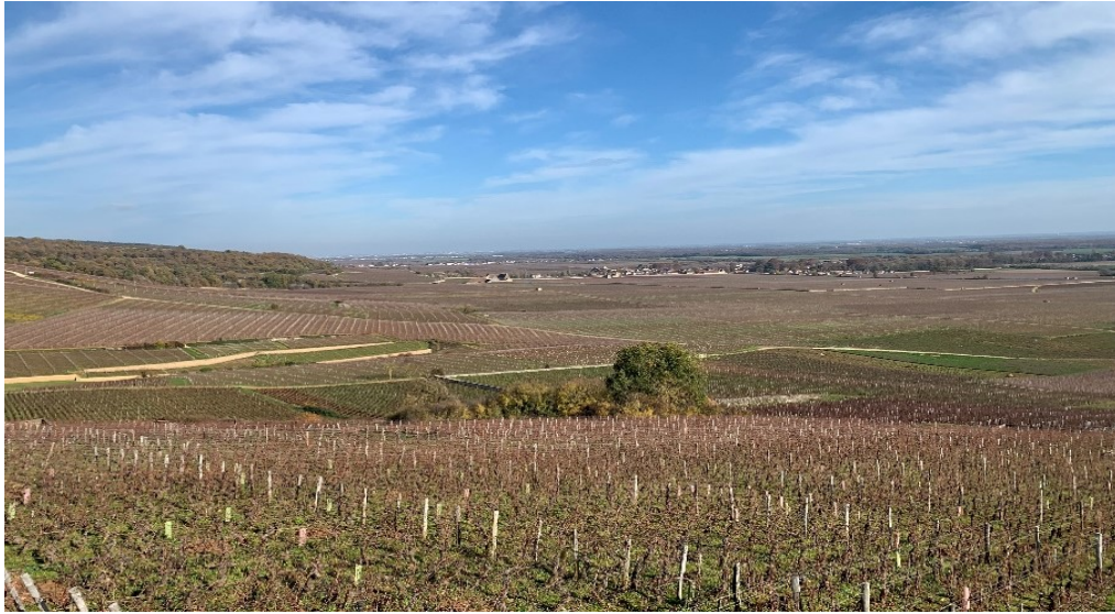
特級、1級に囲まれたVosne-Romanée Aux Champs Perdrixの畑

ピノ ノワール種100%。特級「La Tache (ラ ターシュ)」のすぐ上に位置する「Aux Champs Perdrix (オー シャン ペルドリ)」の区画に約0.9haの畑を所持しています。標高300~350mで浅い粘土石灰質土壤に樹齢約40年の葡萄が植えられています。「Perdrix (ペルドリ)」とはフランス語でヤマウズラの意味で、グリオット(フランスの酸味の強いサクランボ)やイチゴ、コケモモのようなエレガントなアロマ、カシスのようなスパイシーなニュアンスもあり、時間と共に下草や香辛料なども感じられるようになります。肉厚な果実味と複雑さ、余韻は柔らかで若いうちはパワフルですが、瓶熟することでタンニンも溶け込んでオイリーで滑らかになっていきます。