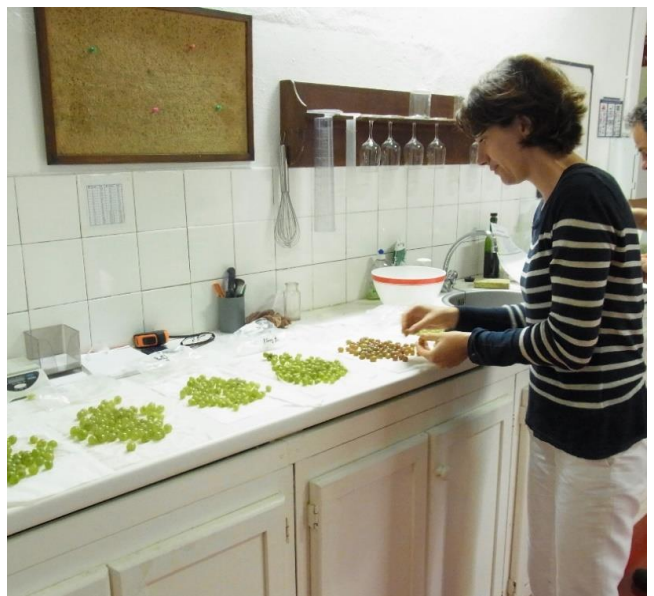
当主のエステル女史(左)と収穫前に各葡萄品種の成熟状態をチェックする様子(右)