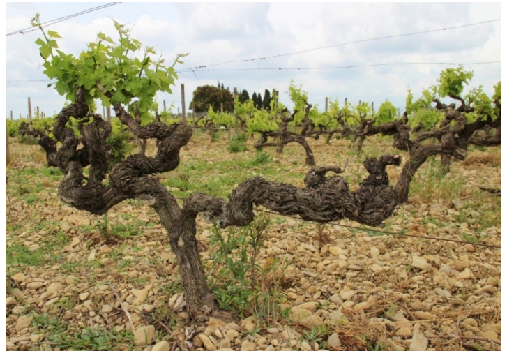
樹齢40年のシラーの木

上記ジュネスト同様こちらもヴィンテージによって使用される葡萄品種の割合が変わりますが、グルナッシュ種55~75%、シラー種25~35%、時々カリニャン種やムールヴェードル種も少量使われます。基本的に上記ジュネストと同じ畑の葡萄を使用し醸造方法も同じコンクリートタンク醸造ですが、こちらの方が樹齢25~50年の若木がメインになるので比較的早いうちからバランス良くまとまってしっかりとした果実味と渋味はありますが飲みやすい仕上がりになる傾向があります。