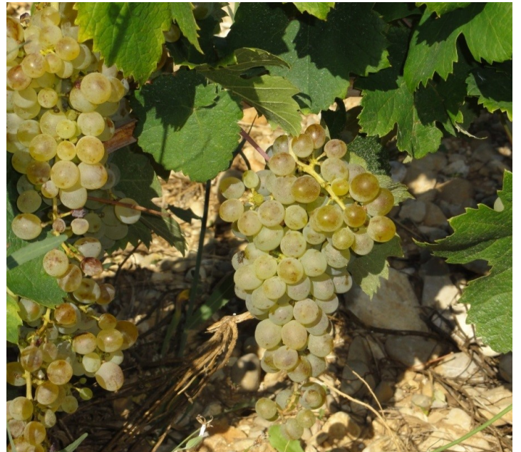
収穫前のグルナッシュ ブランの葡萄

黒葡萄を植え替える際に白葡萄を実験的に植え、2009年に初めて瓶詰されたキュヴェ。使われる葡萄品種の比率がヴィンテージによって変動しますが基本的にグルナッシュブラン種50～55%、ルーサンヌ種20～50%、ヴィオニエ種2%、クレレット種0～25%になります。ヴァケラスのアペラシオンは全体の生産量の97%が赤ワインになるので白ワインは非常に稀です。600ℓの大樽で醸造と熟成を行い、マロラクティック醗酵は自然にまかせているので起きないヴィンテージ(2012、2014年)もあります。南国フルーツのアロマ、香りからは甘い印象を受けますが酸味がしっかりしているので後味はスッキリ、バランス良く飲みやすい白ワインです。