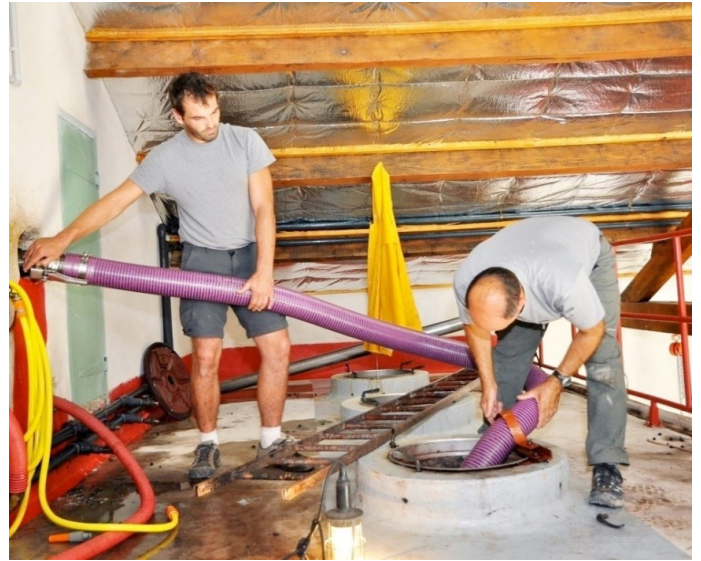
手摘み収穫される葡萄(左)と除梗した葡萄をコンクリートタンクに移す作業(右)