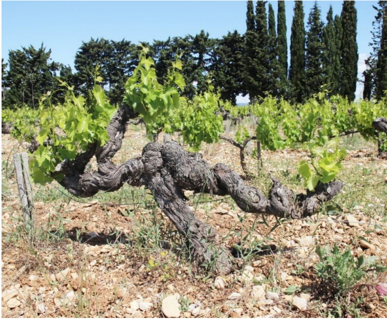
樹齢50年以上のグルナッシュの木

使われる葡萄品種の割合はヴィンテージによって変動がありますが基本的にグルナッシュ種が50~60%、シラー種が40~50%、稀にムールヴェードル種が数%混ぜられることもあります。畑は石が散らばる粘土石灰質土壌でコンクリートタンクで醗酵及び熟成を行います。下記のヴァケラスよりも常にシラーの割合が5~10%多く、収穫時期が遅めの樹齢の古い葡萄(最も古い木は90年以上)が使われる為に果物をかじったような豊かな果実味と凝縮感、若いうちはパワフル&タニックで肉料理が欲しくなるような濃厚な味わいですが、少し落ち着くと驚くほど深みのあるエレガントな印象に変わります。