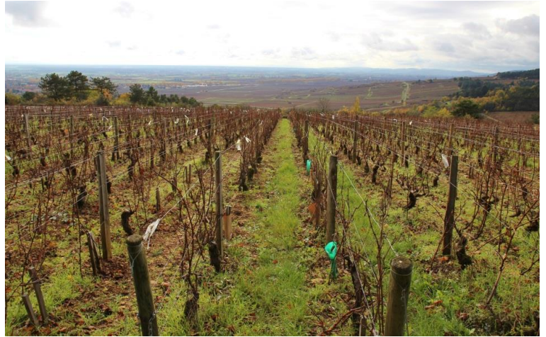
見晴らしが良い「Beaune Clos des Monsnières」の畑(11月)

シャルドネ種100%。畑は真南向きの丘の上であり、広さは約1.3haで平均樹齢は30年、古木は60年にもなります。雨による土砂滑り対策と地中生物による土の活性化を促す為に雑草が植えられていて、その昔フィロキセラの被害に遭った畑でもあります。生のアーモンドやアカシアの花を連想させるような繊細なアロマが香り、ミネラルの爽やかさとグリセリンのオイリーさがバランス良く口の中に広がります。