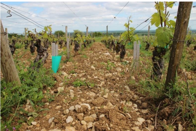
石が多い「Meursault 1級 Cailleret」の畑(5月)

シャルドネ種100%。ヴォルナーとムルソーの境界線にある見晴らしの良い区画で、粘土質土壌の畑には大小たくさんの石灰岩が散らばっています。所有する畑の広さは約0.082haと非常に狭く、葡萄の木は1984～1985年に植えられました。土壌由来の鉱物的なミネラルと凝縮した酸味を豊富に含み、最初はやや固さもありませんが直線的で余韻の長い、非常に高いポテンシャルを秘めたワインです。10年くらいで酸も丸くなってきて良い熟成感を醸し出していきます。