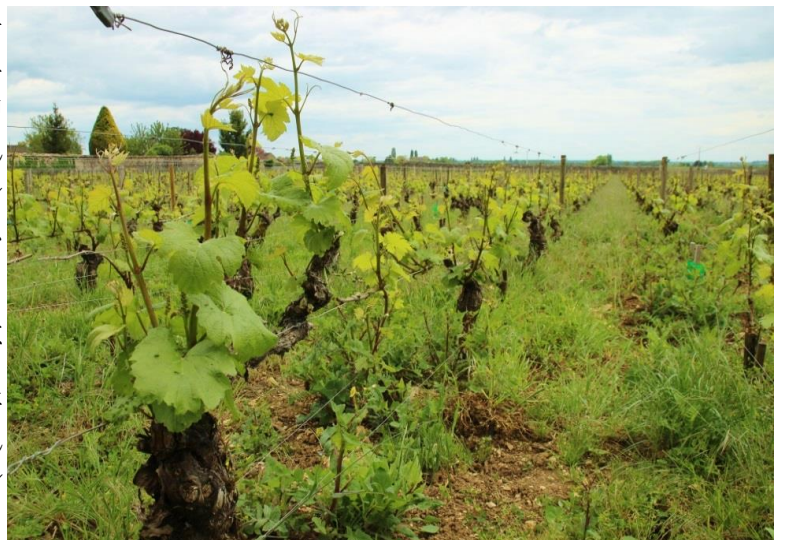
シャトーに隣接する「Meursault Clos de la Velle」の畑 (5月)

シャルドネ種100%。畑は醸造所のあるシャトーに隣接しており、粘土質の緩やかな斜面。とても日当たりの良い区画で広さは約0.86ha、最も古い木は1956年に植樹されました。火打石やパイナップル、ヘーゼルナッツのアロマがあり、果実味と酸味、ミネラルがバランスよく感じられ、凝縮感もあってスマートにまとまっています。1997年に「シャトー ムートン ロートシルト」、レイ ロデレールの「シャンパーニュ クリスタル」と共にフランス大統領晩餐会用ワインに選ばれたこともある、このシャトーを代表するワインになります。