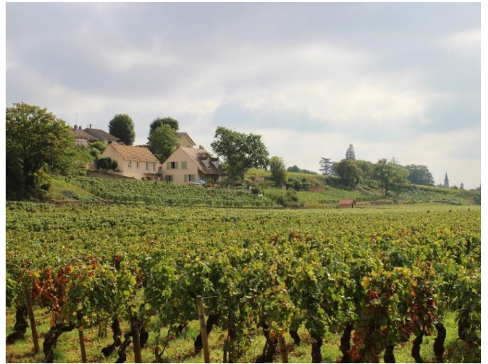
特級コルトンに隣接する「La Combe (ラ コンブ)」の区画

ピノ ノワール種100%。コルトンの丘の東側に位置する「Les Morais (レ モレ)」と南側の特級コルトン シャルルマーニュに隣接する「La Combe (ラ コンブ)」の2区画があり、葡萄の樹齢は70年で、鉄分を多く含む深い粘土質土壌です。15日間のコンクリートタンク醗酵、新樽率約20%で10~12か月間樽熟を行います。色調はペルナンヴェルジュレスよりも濃く、柑橘系フルーツやミントの香り、酸味柔らかくオイリーで素晴らしい凝縮感があり、若いうちは余韻がタニックです。フェミナリーズ (Féminalise) という審査員が女性限定のコンクールで銅メダルを獲得しています。