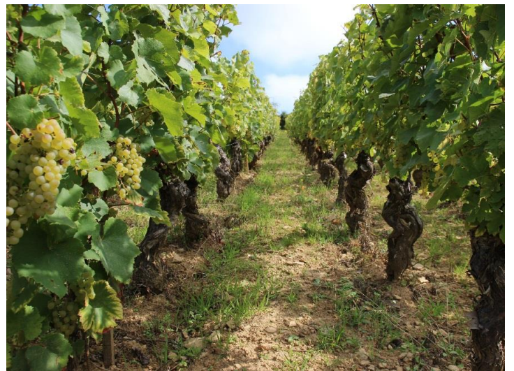
「Les Pins (レ パン)」のシャルドネ区画

シャルドネ種100%。所有畑は南東向きの急斜面で日当たりがとても良い「Les Pins (レ パン)」という区画と同じく南東向きの斜面ですが標高がやや低い「Es Lerret et Vignes Blanches (エレレ エ ヴィーニュ ブランシュ)」の2区画にあります。葡萄の木は樹齢65年にもなる古木でとても凝縮した葡萄が出来ます。青りんごやミントのアロマ、繊細ながらしっかりとした甘旨味ときれいな酸味、ミネラルがあり、余韻も長く楽しめます。アペリティフとしても楽しむことができますし、ホタテのポワレ (フライパンでの蒸し焼き)、魚のグリル、白身の肉、鶏肉のクリームソースなどと良く合います。